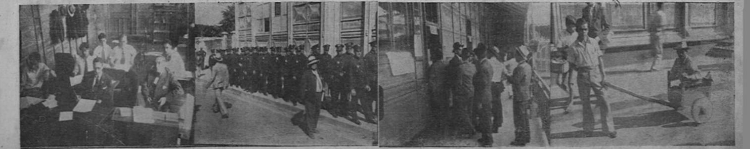
El primer cuadro recoge el momento en que una mesa electoral se apresuraba a recibir un voto. Luego, policías llegando al Edificio Metálico. Finalmente, el público se opina a la puerta de una mesa a fin de depositar su voto y un impedido es conducido para que cumpla con su deber cívico.